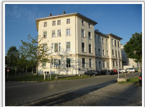
Zytologisches Institut Graz, Auenbruggerplatz 20